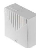
MX00 AU 02H 0W 00 ΜΟΝΑΔΑ ΕΛΕΓΧΟΥ ΜΟΤΕΡ ΜΕ Η΄ ΧΩΡΙΣ ΕΝΣΩΜΑΤΩΜΕΝΟ ΔΕΚΤΗ

Με την εγγύηση ποιότητας του Ιταλικού οίκου COMUNELLO & της ALIRAC