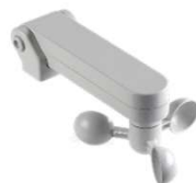
MX00 AR 02N 0G 00 ΑΙΣΘΗΤΗΡΑΣ ΑΝΕΜΟΥ