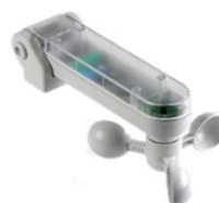
MX00 AR 02N 0T 00 ΑΙΣΘΗΤΗΡΑΣ ΑΝΕΜΟΥ/ΗΛΙΟΥ